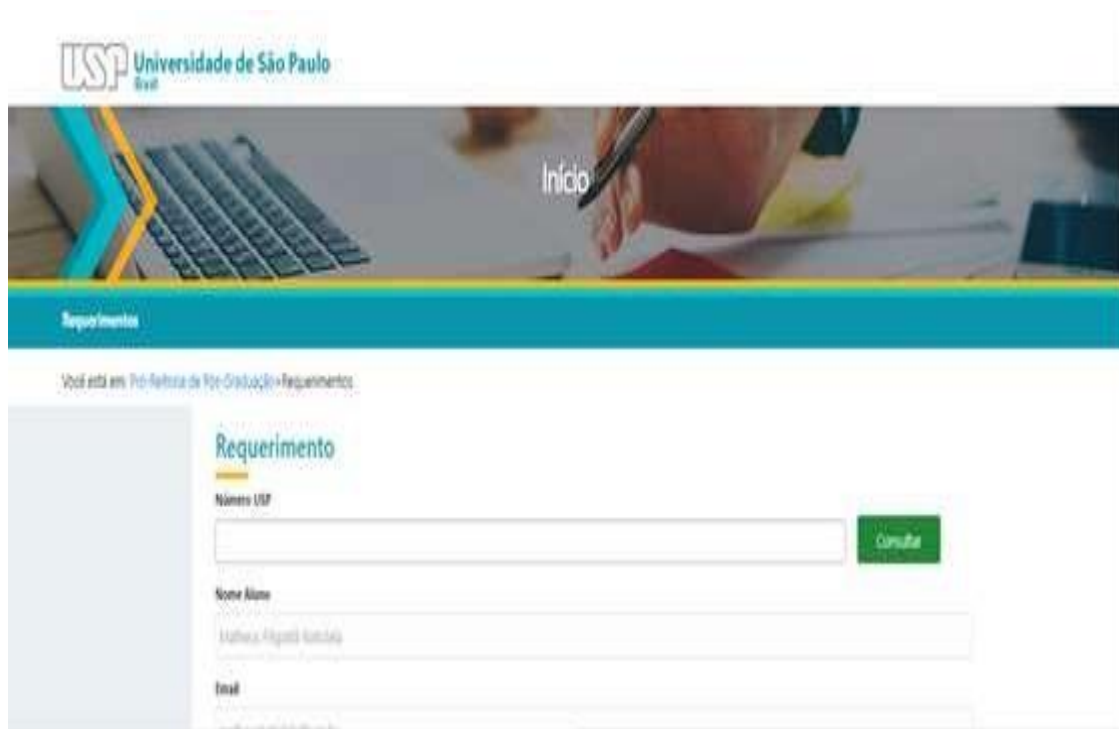
Figura 1: O requerimento está disponível no sistema Janus e quando o aluno acessá-lo, as informações de identificação serão preenchidas automaticamente.