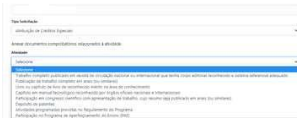
Figura 5: Preenchimento do requerimento Atribuição de Créditos especiais

O solicitante deverá escolher qual a atividade realizada para atribuição como créditos especiais